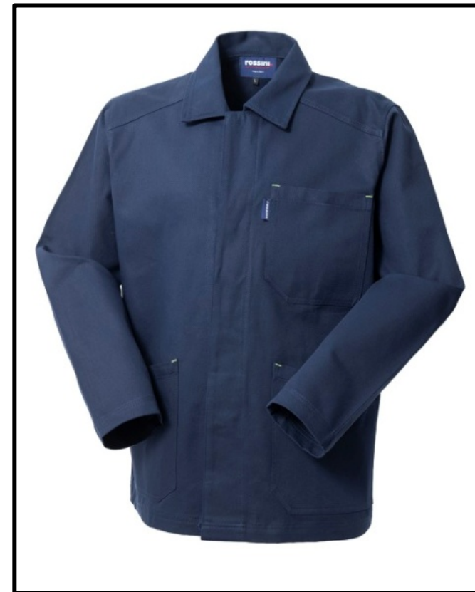
01 - BLU