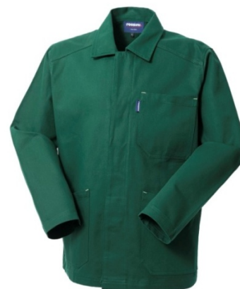
04 - VERDE