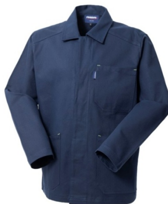
01 - BLU