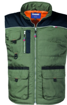
VI – VERDE/NERO