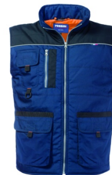
ZX – BLU/NERO