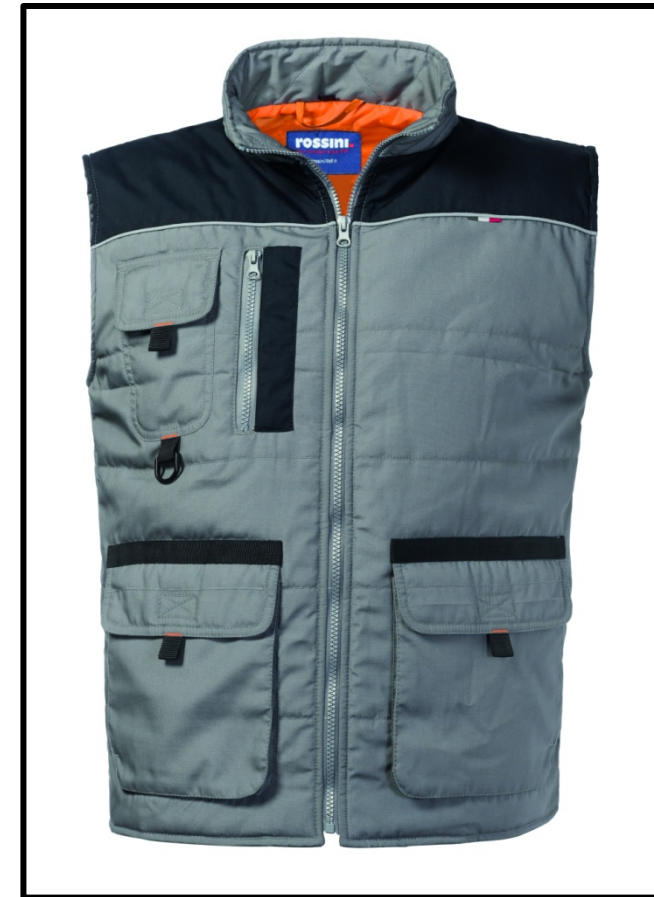
GY – GRIGIO/NERO