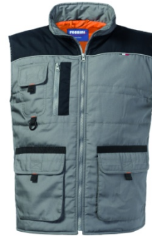
GY – GRIGIO/NERO