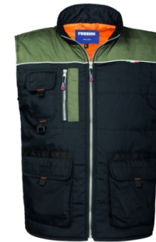
OF – NERO/VERDE