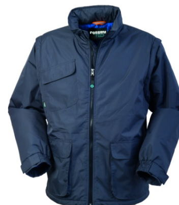
12 – GRIGIO