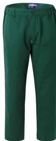
04 – VERDE