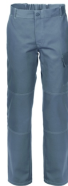
12 - GRIGIO