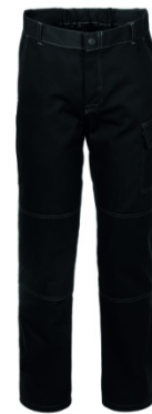
05 - NERO