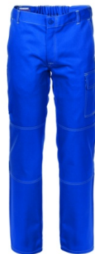
06 - AZZURRO ROYAL