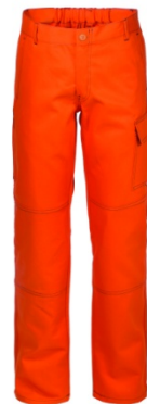
09 - ARANCIO