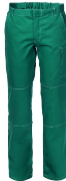
04 - VERDE