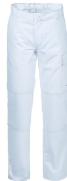
02 - BIANCO